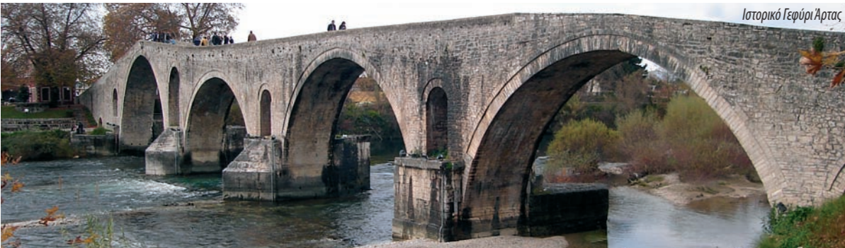
Ιστορικό Γεφύρι Άρτας