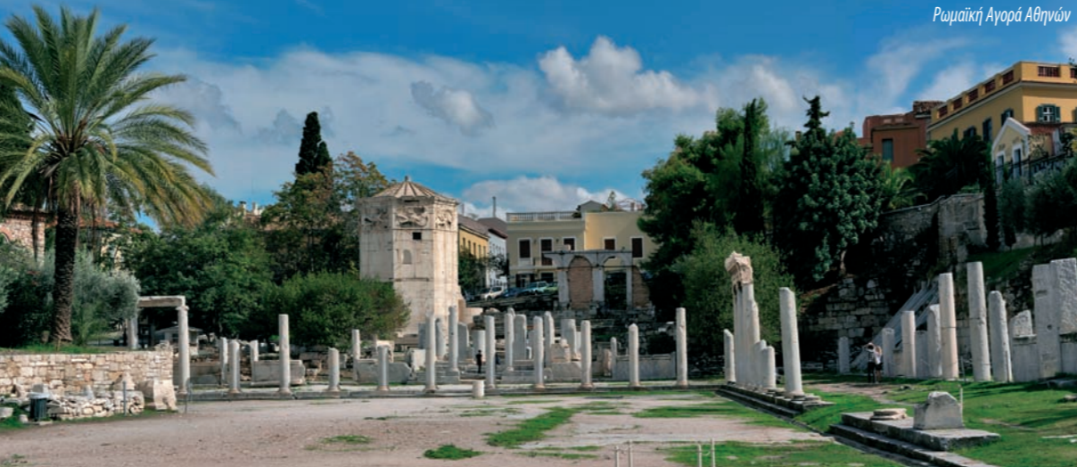
Ρωμαϊκή Αγορά Αθηνών