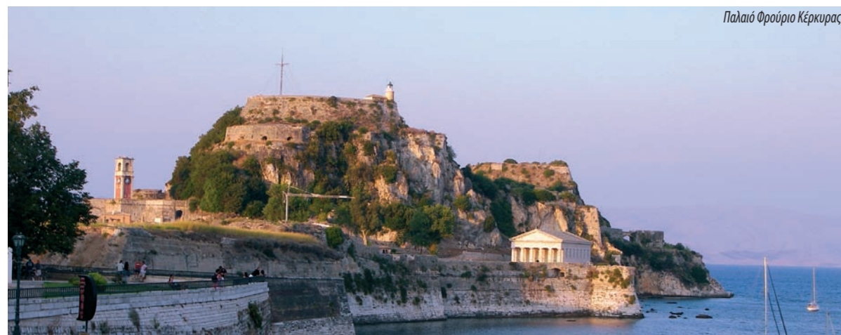
Παλιό Φρούριο Κέρκυρας